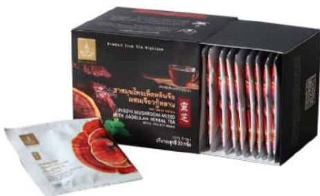
ชาสมุนไพรมเห็ดหลินจือผสมเจียวกุหลาบ

Shelf Life : 2 Years Barcode : 885 8418 007 362