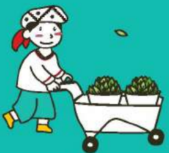
ใบชาสด Fresh Tea Leaves

ชาที่ผ่านกระบวนการหมักอย่างสมบูรณ์ (Completely-fermented tea)