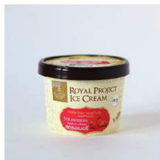
ไอศกรีมรสสตรอว์เบอร์รี่ Strawberry Ice Cream 75 กรัม / g Shelf Life : 1 Month Barcode : 885 8418 026 974