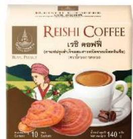
เรชิ คอฟฟี่ (กาแฟปรุงสำเร็จผสมสารสกัดจากเห็ดหลินจือ) Reishi Coffee

Shelf Life : 2 Years Barcode : 885 9631 300 360