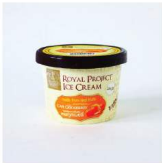
ไอศกรีมรสเคปกูสเบอร์รี่ Cape Gooseberry Ice Cream 75 กรัม / g Shelf Life : 1 Month Barcode : 885 8418 026 998