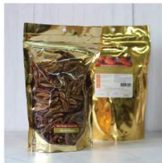
เห็ดหลินจือแดง 3 ลิ Red Reishi Mushroom

Shelf Life : 2 Years Barcode : 885 8418 030 919