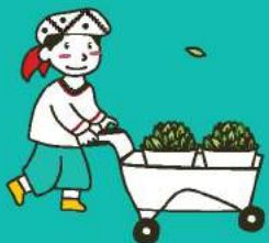
ใบชาสด Fresh Tea Leaves

ชาที่ผ่านกระบวนการหมักเพียงบางส่วน (Semi-fermented tea)