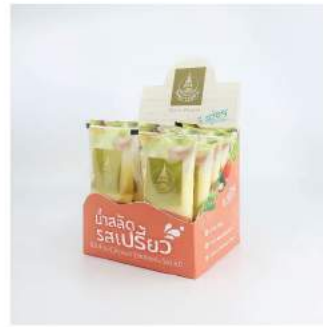
น้ำสลัดรสเปรี้ยว Sour & Creamy Dressing Salad 75 กรัม / g Shelf Life : 2 Months Barcode : 885 8418 846 558