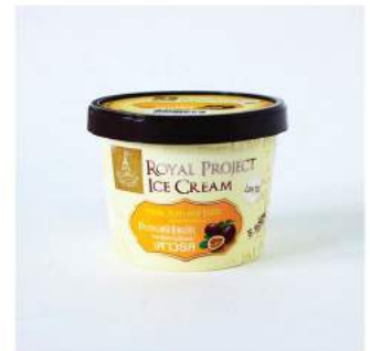
ไอศกรีมรสเสาวรส Passion Fruit Ice Cream 75 กรัม / g Shelf Life : 1 Month Barcode : 885 8418 026 981