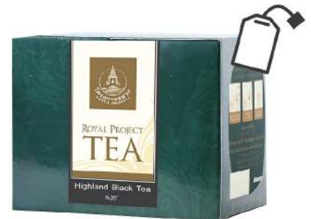
หงชา Highland Black Tea

Shelf Life : 2 Years Barcode : 885 8418 029 944