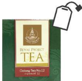
ชาอู่หลง 12 Oolong Tea 12 (Sachet)

Shelf Life : 2 Years Barcode : 885 8418 846 473