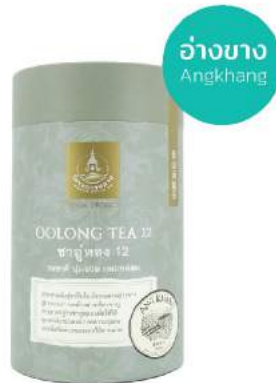
Oolong Tea 12 (Loose Leaf)

Shelf Life : 2 Years Barcode : 885 8418 888 886