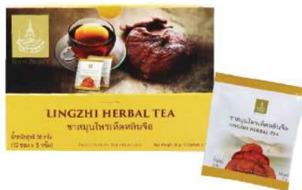
ชาสมุนไพรมเห็ดหลินจือ Lingzhi Herbal Tea

Shelf Life : 2 Years Barcode : 885 8418 613 273