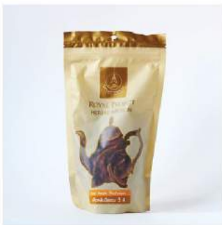
เห็ดหลินจือแดง 3 ลิ Red Reishi Mushroom