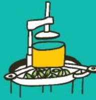
นวดขึ้นเม็ด Rolling / Shaping