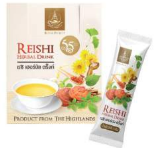
เรชิ เฮอร์บัล ดริงก์ Reshi Herbal Drink