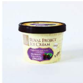
ไอศกรีมรสหมัลเบอร์รี่ Mulberry Ice Cream 75 กรัม / g Shelf Life : 1 Month Barcode : 885 8418 027 124