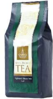
หงชา (ชาใบ) Highland Black Tea (Loose Leaf)

Shelf Life : 2 Years Barcode : 885 8418 862 268