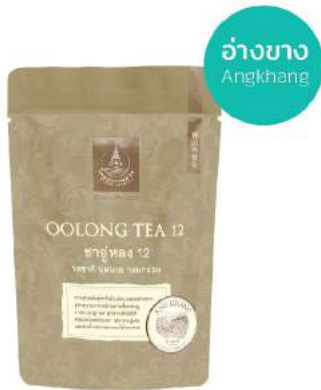
ชาอู่หลง 12 (ชาใบ) Oolong Tea 12 (Loose Leaf)