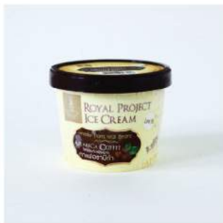
ไอศกรีมรสกาแฟอาราบิก้า Arabica Coffee Ice Cream 75 กรัม / g Shelf Life : 1 Month Barcode : 885 8418 027 018