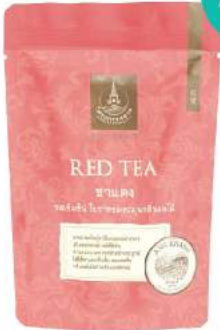
ชาแดง (ชาใบ) Red Tea (Loose Leaf)