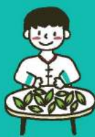
ผึ่งในร่ม+นวดชา Indoor Withering +Rolling