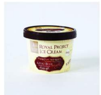
ไอศกรีมรสถั่วอะซุกิ Azuki Bean Ice Cream 75 กรัม / g Shelf Life : 1 Month Barcode : 885 8418 027 001