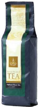
หงชา (ชาใบ) Highland Black Tea (Loose Leaf)

Shelf Life : 2 Years Barcode : 885 8418 028 923