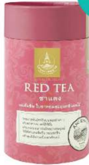
ชาแดง (ชาใบ) Red Tea (Loose Leaf)