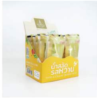
น้ำสลัดรสหวาน Sweet & Creamy Dressing Salad 75 กรัม / g Shelf Life : 2 Months Barcode : 885 8418 846 541