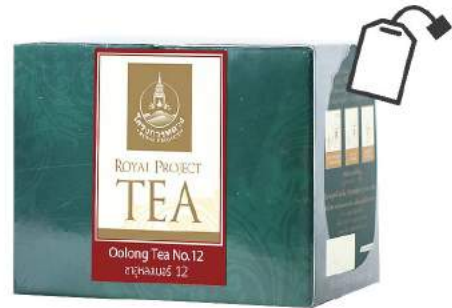
ชาอู่หลง 12 Oolong Tea 12 (Sachet)

Shelf Life : 2 Years Barcode : 885 8418 029 937