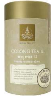
ชาอู่หลง 12 (ชาใบ) Oolong Tea 12 (Loose Leaf)

Shelf Life : 2 Years Barcode : 885 8418 862 275