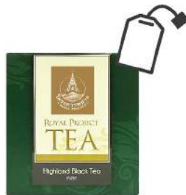
หงชา Highland Black Tea

Shelf Life : 2 Years Barcode : 885 8418 028 930